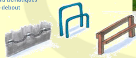
Appuis ischiatiques assis-debout

La mise en place d'appuis et de bancs à hauteur réglementaire (entre 0,90 et 1,3 m)