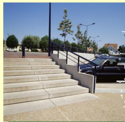
Prolongement de la rampe